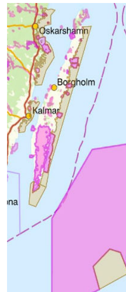
Nuvarande Natura 2000-områden markerat i lila. Förslag till nya Natura 2000-områden markerat i brun.

Den tyngsta kritiken kommer från den regionala utvecklingsnämnden som vill att Kalmars regionstyrelse helt avstryker länsstyrelsens förslag. Utvecklingsnämnden styrker lantbrukarnas negativa reaktioner och anmärker själva att processen har haft brister, främst avsaknad av en fördjupad konsekvensanalys med större inflytande av andra intressen.