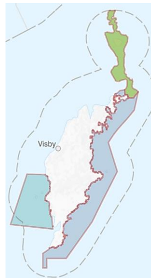
Länsstyrelsen Gotlands förslag på Natura 2000-områden.

Andra intressenter har påpekat att Natura 2000-områden innebär i praktiken ett omfattande förbud mot brukande och utveckling vilket kommer ha en stor negativ effekt på den regionala utvecklingen. Ett helhetsperspektiv med en grundlig konsekvensanalys bör